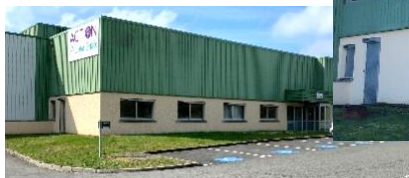
Avant et après création des ouvertures à l'étage