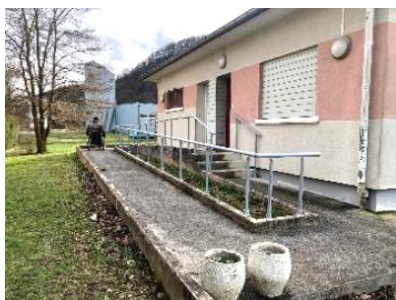
Rampe d'accès PMR

Appartement T4 situé à Pays de Clerval, entièrement adapté aux personnes à mobilité réduite