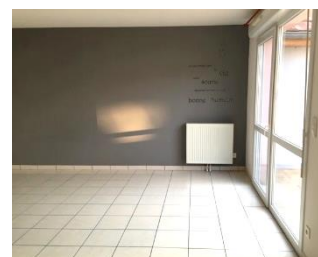
Appartement T3 situé à Anteuil