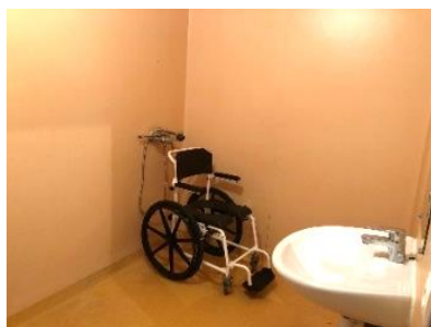
Salle de bains adaptée