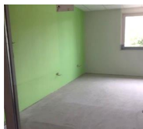
Plateau technique couleur verte