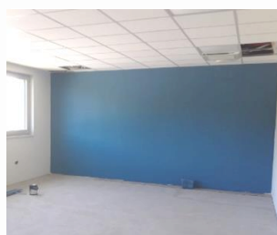
Plateau technique couleur Nénuphar