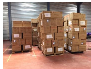
Cartons contenant les 616 000 masques