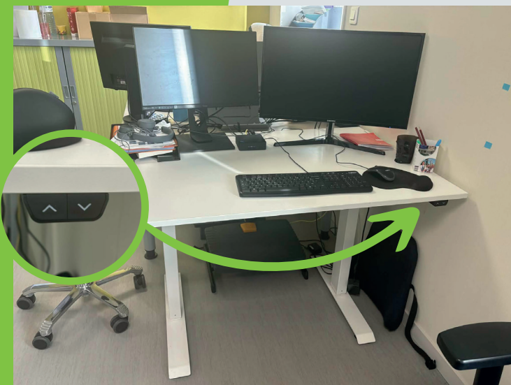
Un bureau adapté, réglable en hauteur

Enfin, des investissements ont été réalisés dans du matériel ergonomique afin d'améliorer le confort au travail et de proposer des postes mieux adaptés aux besoins de chacun.